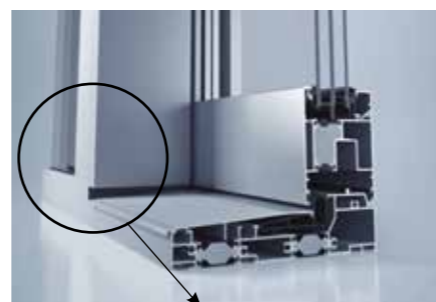
EGE 77SD-SL avec partie latérale tout verre pour une transparence maximale

EGE 77SD-SL est une construction à cadre filigrane presque invisible qui permet un vitrage de grande surface avec un maximum de transparence. Naturellement, ce système levant-coulissant innovant répond également à toutes les exigences en matière d'isolation thermique. Un point culminant de l'architecture pour les nouveaux bâtiments et les rénovations