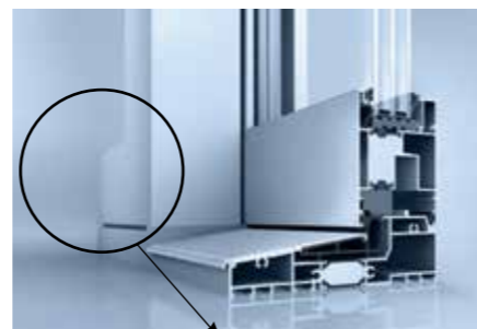
EGE 77SD avec profilé d'ouvrant dans la partie latérale

Dans cette variante, un profilé d'ouvrant est également utilisé dans la partie latérale pour une vue identique de l'ouvrant coulissant et fixe ou pour les systèmes qui peuvent être poussés des deux côtés.