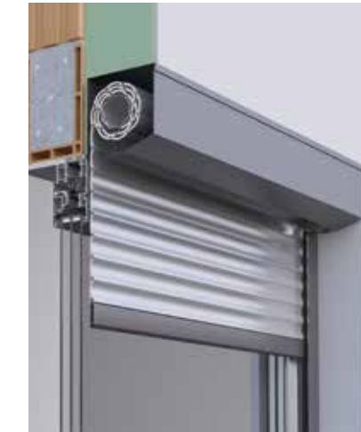
Der eckige EGE -Vorbaurollladen VARIMAXX findet seinen Platz in der Fensterlaibung und schließt mit der Fassade ab.

Der Clou beim FORMADO ist: Sie sehen möglicherweise nur den halben Kreis. Die andere Hälfte des Rollladenkastens kann in der Laibung Ihrer Fenster verborgen sein. Formado ist ein Vielkünstler und macht bei unterschiedlichen Einbautiefen sowie auf dem Mauerwerk eine gute Figur. Das Formado-System präsentiert sich in einer harmonisch-modernen Gestaltung mit zeitloser Designsprache. Es ist robust und vermittelt gleichzeitig eine Leichtigkeit. Das Resultat ist eine Formgebung, die sich ausgeglichen in die Architektur einfügt.