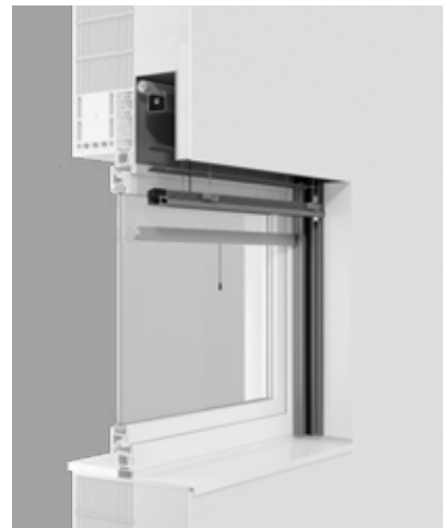
Das Raffstorensystem MODULO kann mit unterschiedlichen Lamellen und einem integrierten Insektenschutz ausgestattet werden