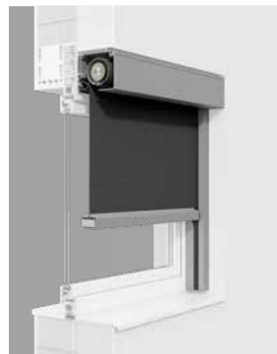
Kompakt: Auch bei großen Fensterflächen benötigen zipSCREENs nur sehr kleine Kästen