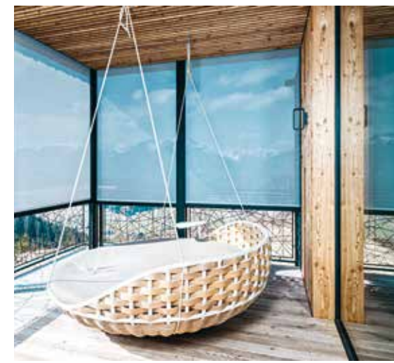
Schutz vor Zugluft und neugierigen Blicken auch im Freien