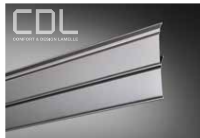
Die Comfort & Design Lamelle CDL bietet Sicherheit und Sonnenschutz in ganz neuer Qualität

Die hochwertigen Aluminiumlamellen sind äußerst langlebig und reflektieren die Sonneneinstrahlung. Das verhindert ein Aufheizen der Räume durch Sonnenlicht um bis zu 75%.