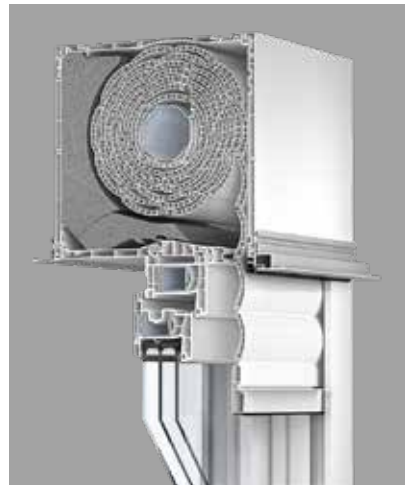
EGE-Fenster mit dem Rollladen-Aufsatzsystem VARINOVA bieten exzellente Wärmedämm- und Schallschutzwerte