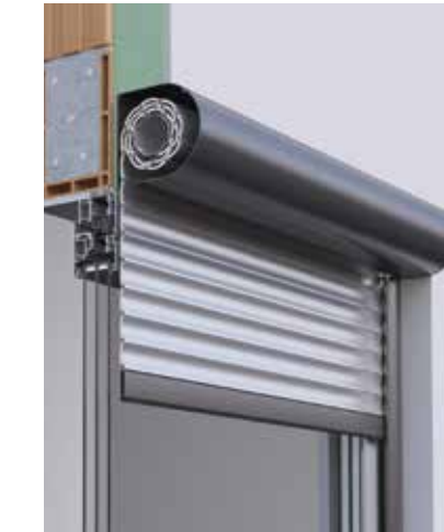
Beim Rund-Rollladensystem FORMADO sehen Sie nur, was Sie möchten – Ihre Wunschform. Nuten von Öffnungsklappen z.B. sehen Sie nicht.