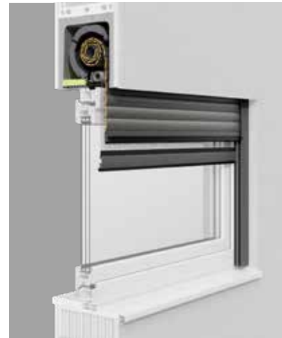
EGE-Fenster mit Sanierungsrollladen TERMO 2. Der vorhandene Sturzkasten bleibt erhalten, das Innenleben auf aktuellsten Stand gebracht!