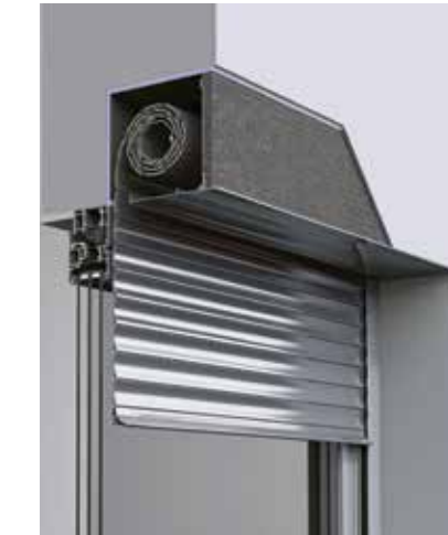
Das PUNEXT-System: Von außen sehen Sie nicht außer Ihr EGE -Fenster und die Putzfassade.