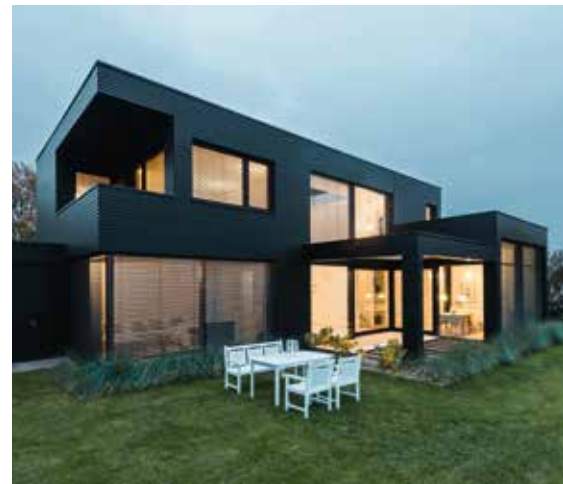
Moderne Optik, höchste Flexibilität: ROMA Raffstoren als Sicht- und Sonnenschutz