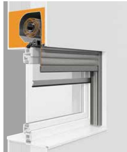
EGE-Fenster mit dem Rollladen-Aufsatzsystem PURO bieten exzellente Wärmedämm- und Schallschutzwerte