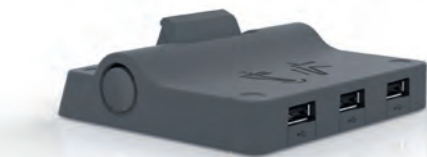
TaHoma® Serenity Dock