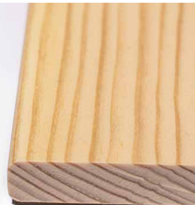
Standardausführung mit Feinschliff