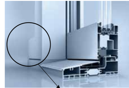
EGE 77SD mit Flügelprofil auch im Seitenteil

Das Hebe-Schiebesystem EGE 77SD verfügt über eine modular aufgebaute Dämmzone. Das Ergebnis: Weniger Energiefluss zwischen innen und außen, weniger Energiekosten. In dieser Variante kommt auch im Seitenteil ein Flügelprofil zum Einsatz für eine gleiche Ansicht von Schiebe- und Standflügel oder für beidseitig aufschiebbare Anlagen.